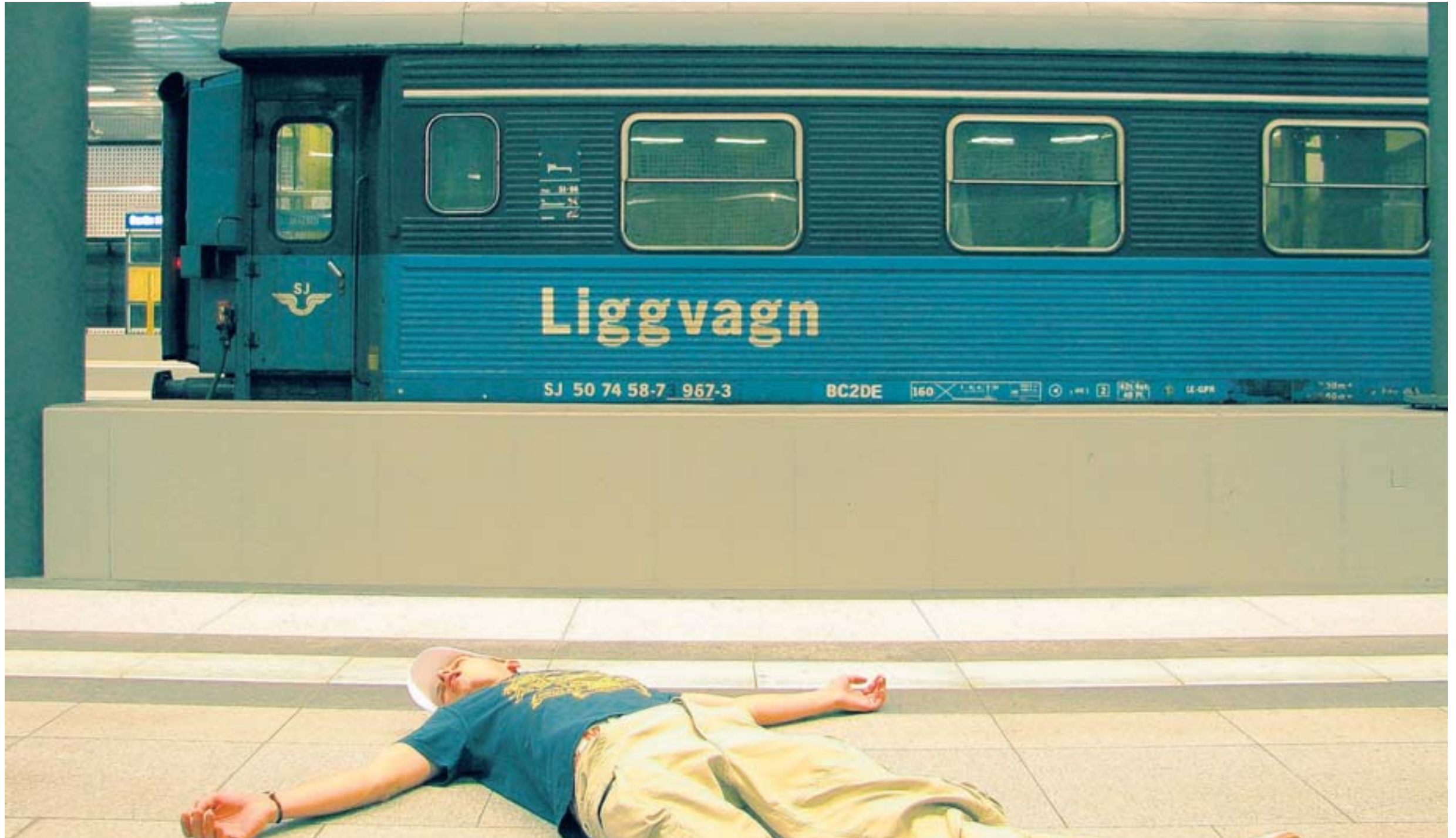
Wer gegen seine innere Uhr lebt, steigert das Risiko, auf Bahnsteigen vor schwedischen Liegewagen einzuschlafen.